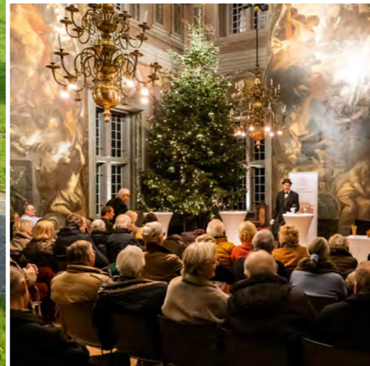
FHG Projekt: Weihnachtliche Lesung

Selbstverständlich erhalten Sie unverzüglich eine Spendenbescheinigung.