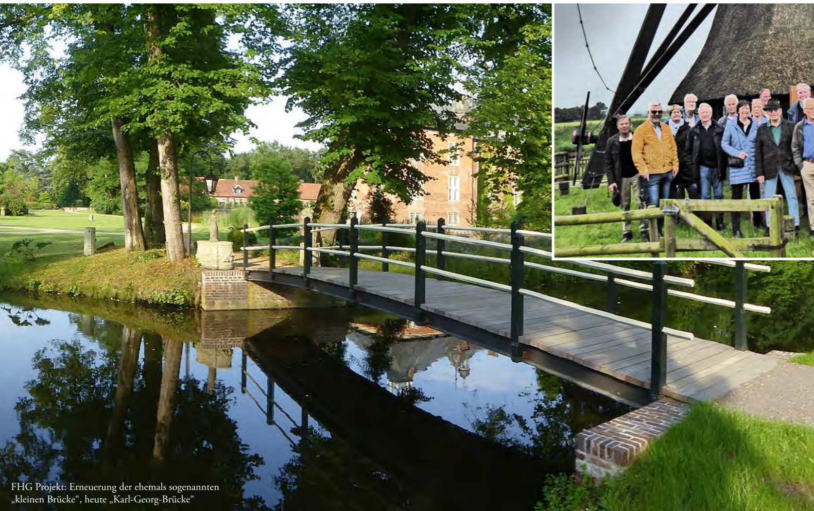
FHG Projekt: Erneuerung der ehemals sogenannten „kleinen Brücke“, heute „Karl-Georg-Brücke“