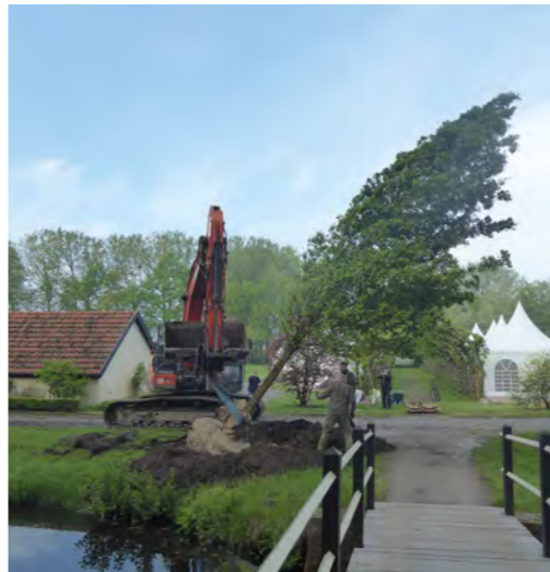
FHG Projekt: Anpflanzung von zwei Eichen