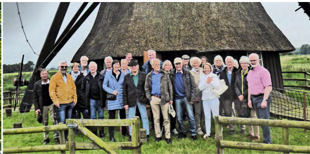
FHG-Projekt: Förderung der v. Wedelschen Wassermühle